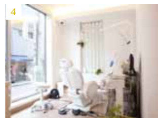
4. 陽の光の入る、クリーニング専用のユニット

した。若いドクターたちにも、夢は必ずかなうということを知っていただければと思います。また、日本の歯科医療を進歩させるために、セレックなどの医療機器をもっと国内に広めていきたいですね」