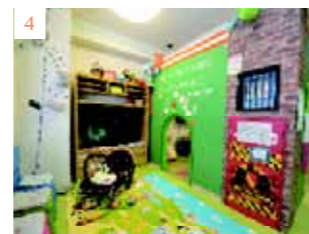
3. 明るい色を基調とした診療室は治療の恐怖感を和らげる 4. リトミックを定期的に開催し、歯科医院に通う習慣を楽しく演出